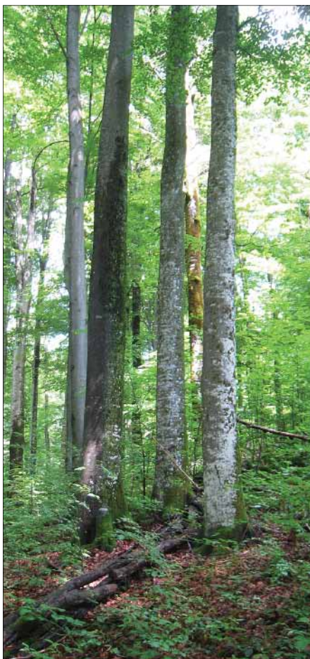
Abb. 1: Natürliche Waldentwicklung im Buchenurwald Uholka in den Ukrainischen Karpaten.