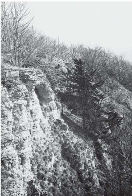
Eibe am Steilhang der Graburg bei Weißenborn um 1915