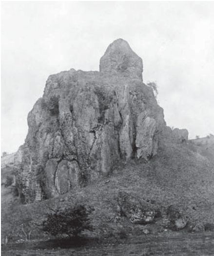
Wichtelkirche um 1910