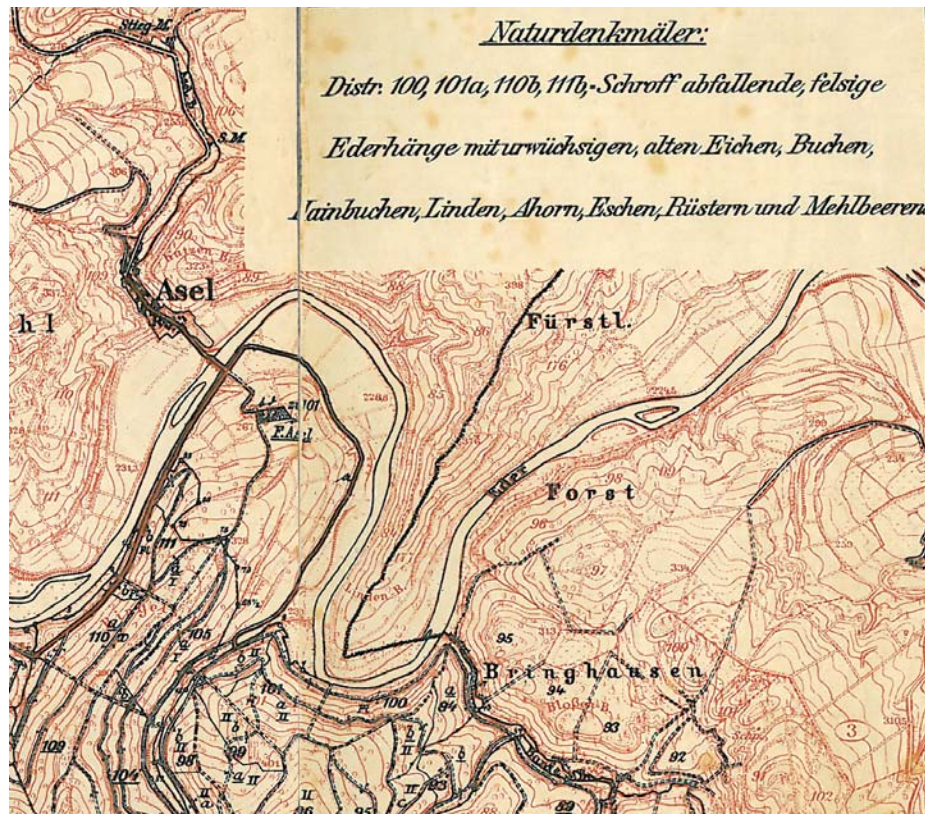
Ausschnitt aus einer vor 1914 entstandenen Forstwirtschaftskarte für die Oberförsterei Altenlotheim mit Auflistung der Naturdenkmäler.

Während des Ersten Weltkrieges und in den wirtschaftlich schwierigen 1920er Jahren erhöhte sich der Nutzungsdruck, insbesondere vonseiten der Steinbruchindustrie und der Forstverwaltung, sodass vom Naturschutz in dieser Zeit eine Reihe schwerer Rückschläge hingenommen werden musste, wie am Beispiel zahlreicher Einzelgebiete gezeigt wird. SCHAEFER (1926a) spricht