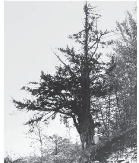
Alte Eibe am Badenstein bei Witzenhausen um 1915