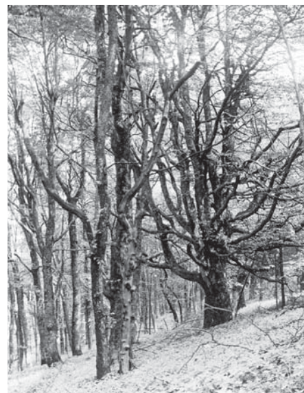
Kesselrain bei Wüstensachsen um 1920

Das direkt an der Grenze zu Bayern auf 760 – 840 m ü. NN gelegene Waldgebiet des Kesselrains bei Wüstensachsen galt bis zum Beginn des 20. Jahrhunderts als einzigartiger Urwaldrest mit hohem Totholzvorrat und bemerkenswerter, montan geprägter Bodenvegetation (SCHAEFER 1913B, HUECK 1926). SCHAEFER (1927A) bezeichnet es als ehemals „bedeutendste Naturwaldgebiet Mitteldeutschlands“. Die große Naturnähe des Gebietes, das hohe Alter und der bemerkenswerte Stammumfang der Bäume werden bereits im Forstbotanischen Merkbuch (RÖRIG 1905) hervorgehoben. Nachdem der Kesselrain 1911 durch einen Holzabfuhrweg erschlossen worden war, scheiterten die Bemühungen des Bezirkskomitees für Naturdenkmalpflege um eine Verlegung des Weges. Die 1912 geplante Abholzung des Gebietes und Wiederaufforstung mit Fichte konnte verhindert, und die Zusage der Forstverwaltung, wenigstens eine Forstabteilung unberührt zu lassen, zunächst erwirkt werden. Allerdings erfolgte 1925 ein Holzeinschlag im gesamten Gebiet.