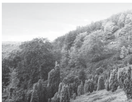
Paradies bei Gellershausen um 1920

Für die ehemalige Hutefläche mit alten Eichen und Buchen verpflichtete sich auf Anregung des Fürsten von Waldeck die Fürstliche Domänenkammer 1911 zu einem Nutzungsverzicht, zunächst bis 1917. Eine Anzahl alter Bäume wurde dann aber 1920 entnommen (ORTLOFF 1926). Auch wenn das „Paradies“ erst 1980 als Naturschutzgebiet (7 ha) ausgewiesen wurde (LÜBCKE 1987), scheint nach 1920 keine forstliche Nutzung mehr stattgefunden zu haben.