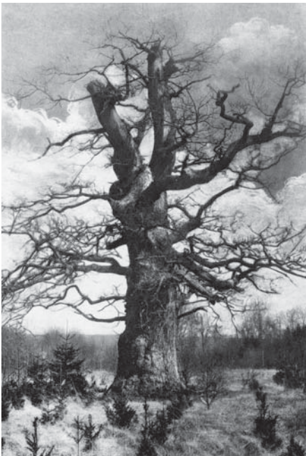
Bei der Sababurg um 1910; Fichtenanpflanzung bedroht Huteeiche.

Zu den wichtigsten Aufgaben des Bezirkskomitees gehörte die Erarbeitung von Vorschlägen zur Pflege und Erhaltung von Naturdenkmälern und die Erarbeitung von Anträgen zur Unterschutzstellung (SCHAEFER 1926B). Die Ausweisung der Schutzgebiete erfolgte in den einzelnen Gebieten – je nach Besitzverhältnissen – auf unterschiedlichem Wege. Wie dies im Einzelnen geschah, welche Schwierigkeiten dabei u. U. zu überwinden waren und welche Rückschläge hingenommen werden mussten, soll im Folgenden am Beispiel einer Auswahl von Gebieten dargestellt werden. Einen Überblick über die bis 1927 unter Schutz gestellten Gebiete geben Karte Seite 63 und Tabelle 1.