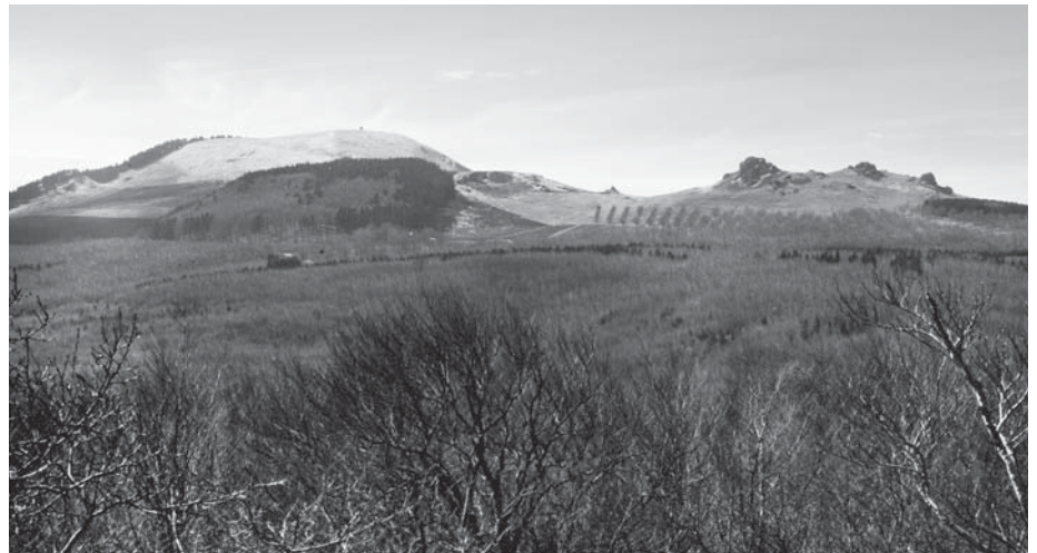
Blick von der später durch Basaltabbau zerstörten Kuppe des Hangarsteins bei Fürstentwald zum Hohen Dörnberg (links) mit dem 1913 unter Naturschutz gestellten Helfenstein (rechts) im Jahr 1908

Der seit 1945 bzw. in seiner heutigen Abgrenzung seit 1981 bestehende Regie-