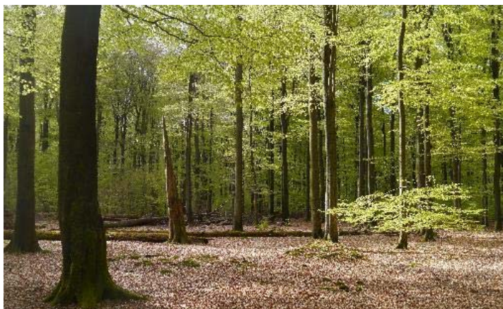
Foto 1: Der Naturwald Limker Strang im Solling

Im Sachgebiet Arten- und Biotopschutz werden Konzepte für den Schutz und die Wiederherstellung von Lebensräumen im Wald erarbeitet. Weitere Schwerpunkte bilden Monitoring und Wirkungskontrolle sowie die Weiterentwicklung von Indikatorensystemen für die biologische Vielfalt (z. B. Waldarten-, Naturnähe- oder Störungszeigerlisten).