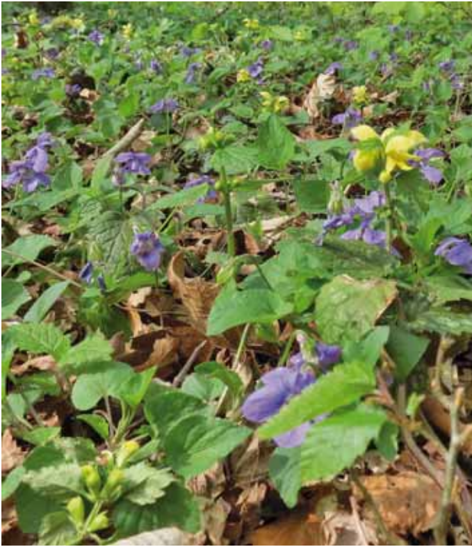
Wald-veilchen und Goldnessel kommen gemeinsam im Austausch- und Silikat-Pufferbereich vor.