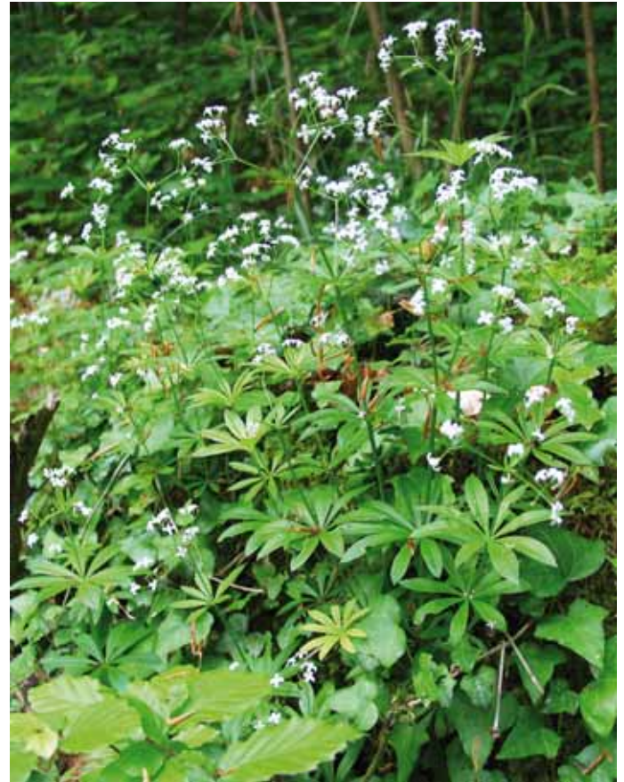
Der Waldmeister tritt im Austausch-, Silikat- und Karbonat-Pufferbereich auf.

In der Forstlichen Standortskartierung geben Bodenmerkmale wie die Humusform (Mull, Moder, Rohhumus) oder Podsolierungserscheinungen (Bleichung im Oberboden infolge einer Versauerung) Hinweise auf den Pufferbereich, in dem sich ein Waldboden befindet. Darüber hinaus können aber auch Waldbodenpflanzen als Indikatoren für bestimmte pH-Bereiche dienen. Um diese Indikatoreigenschaften vieler Waldpflanzen optimal nutzen zu können, muss die Spannweite der pH-Werte bekannt sein, bei denen die Arten im Wald auftreten. Mit dem im Rahmen der Bodenzustandserhebung II erhobenen Vegetationsdatensatz liegt eine einzigartige Datengrundlage vor, aus der für die un-