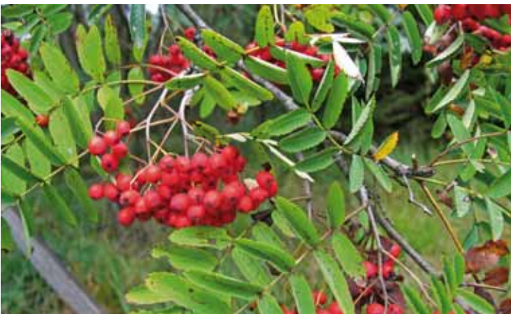
Rotstengelmoos, Besenheide und Vogelbeere sind charakteristische Arten des Eisen- und Aluminium-Pufferbereichs.