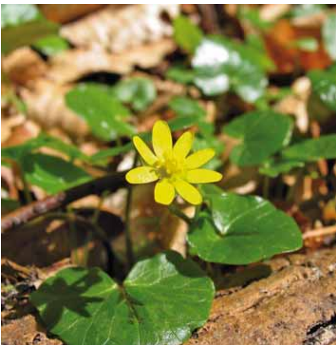
Das Scharbockskraut kennzeichnet den Austausch-, Silikat- und Karbonat-Pufferbereich.