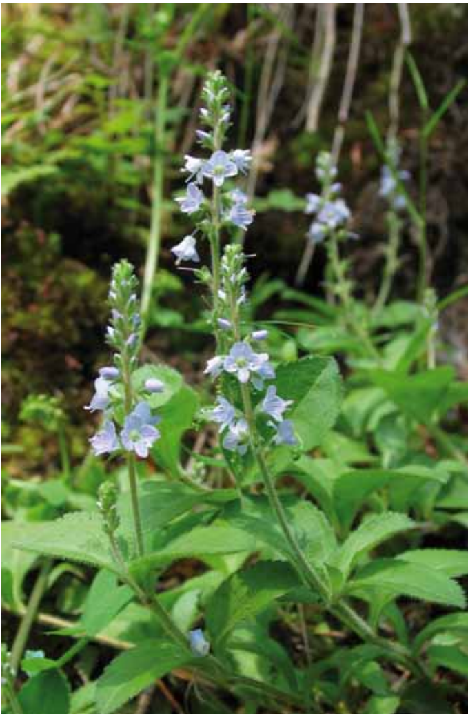
Der Vorkommensschwerpunkt des Wald-Ehrenpreises liegt im Aluminium-Pufferbereich.

Der pH-Wert eines Bodens, die sogenannte Bodenreaktion, ergibt sich aus der Wasserstoff-Ionen-Aktivität in der Bodenlösung. Er hat Einfluss auf zahlreiche chemische und biologische Prozesse im Boden und ist eine der wichtigsten bodenökologischen Kenngrößen, aus der sich viele für das Pflanzenwachstum bedeutsame Bodeneigenschaften, wie die Basen- und Nährstoffversorgung, ableiten lassen. So ergeben sich aus dem pH-Wert einerseits sehr gute Hinweise auf die Verfügbarkeit von Nährstoffen (z. B. Magnesium oder Calcium) und andererseits auf toxisch wirkende Kon-