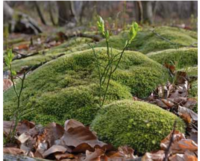
Dominanzbestände von Weißmoos, hier zusammen mit Heidelbeere und Draht-Schmiere, weisen darauf hin, dass sich der Oberboden des betreffenden Waldbestandes im Eisen-Pufferbereich befindet.