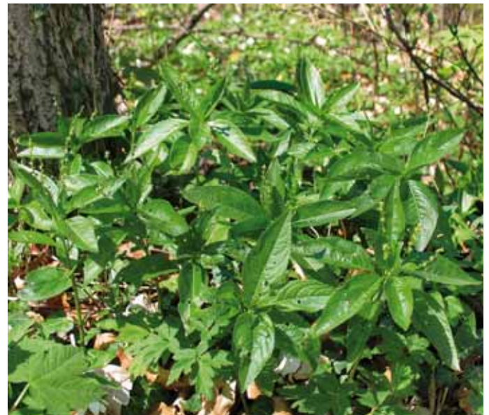
Das Wald-Bingelkraut kennzeichnet den Silikat- und Karbonat-Pufferbereich.