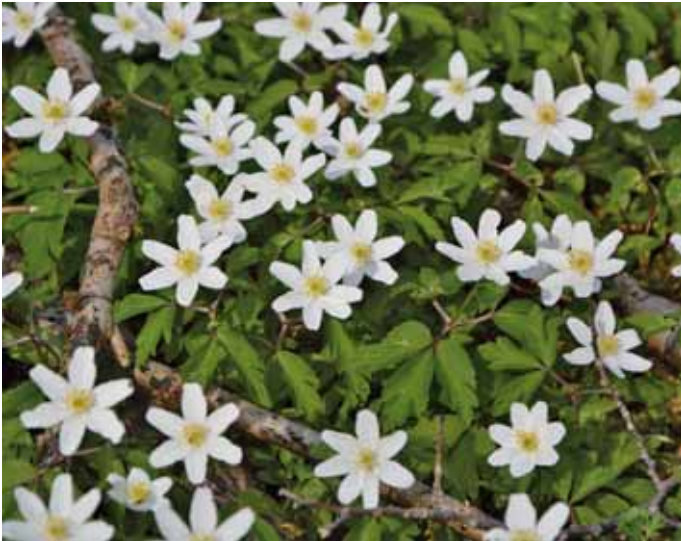
Das Busch-Windröschen fehlt nur im Eisen- und im Aluminium-Pufferbereich. Auf allen basenreicheren Waldböden ist die Art weit verbreitet.

zentrationen von Elementen wie Aluminium oder Mangan. Dementsprechend ist die Bindung vieler Pflanzenarten und Pflanzengesellschaften an bestimmte pH-Bereiche (auch als Pufferbereiche bezeichnet) unter einheitlichen klimatischen Bedingungen sehr eng.