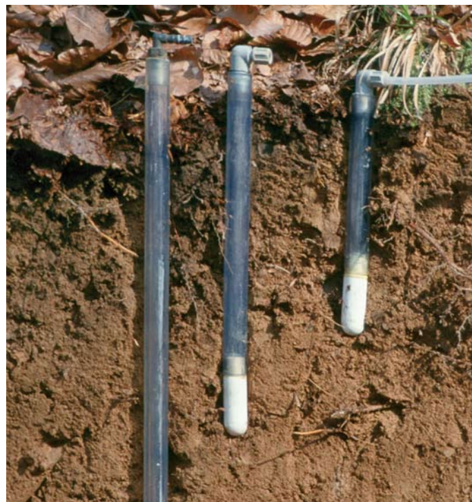
Saugkerzen zur Gewinnung von Bodenlösung

Auf den unverlehmt Sanden sind die Gehalte von Zink, Nickel und Kobalt in der Bodenlösung unter Kiefer signifikant höher als unter Buche. Hinsichtlich der Blei-, Cadmium und Chromgehalte unterscheiden sich Kiefer und Buche jedoch nicht.