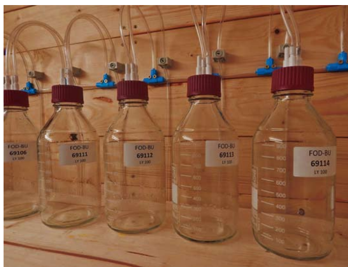
Mit Unterdruck wird Bodenlösung aus verschiedenen Bodentiefen gewonnen

Eine Belastung des Grundwassers durch anthropogen bedingt erhöhte Austräge unter Wald ist für die Schwermetalle Kupfer, Nickel und Chrom nicht zu befürchten, für Zink und Kobalt kann sie auf einigen Flächen nicht ausgeschlossen werden.