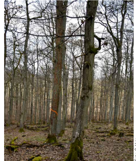
Abb. 3: Vom Specht auf der Suche nach Prachtkäferlarven, -puppen und Käfern gerötete Eiche im Bestand. Charakteristisch: Es wird nur die äußere, grobe Borke abgeschlagen da sich hier die überwinternden letzten Entwicklungsstadien befinden.

In Niedersachsen ist die Fläche mit auffälligem Vorkommen und zumeist mittlerer Fraßintensität durch die EFG (v. a. Eichenwickler ) auf etwa 2.300 ha angestiegen. In Hessen wurden 2023 dagegen lediglich auf rund 160 ha Schäden durch die EFG und den EPS festgestellt, und in Schleswig-Holstein wurde lediglich auf etwa einem Hektar das Vorkommen des EPS dokumentiert. In Sachsen-Anhalt ging die Fläche mit Fraßschäden durch die EFG unter Beteiligung des EPS auf etwa 1.700 ha und gegenüber dem Vorjahr um etwa zwei Drittel zurück. Lediglich auf klei-