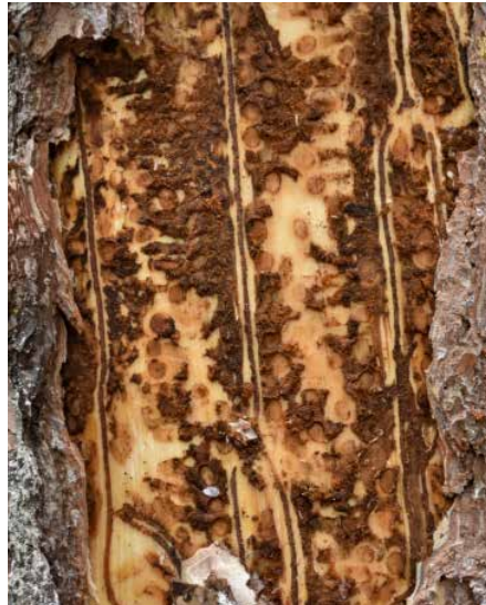
Abb. 2: Detailaufnahme eines Fraßbildes des Zwölftzähligen Kiefernborke- nkäfers an Altkiefer

Im Jahr 2023 wurde im Rahmen des regelmäßigen Maikäfermonitorings wieder die Dichte dreijähriger Engerlinge (E3) des Waldmaikäfers im Raum Hanau-Wolfgang durch Probestellungen untersucht. Die mittlere Anzahl gefundener Engerlinge je Rasterpunkt belief sich auf 3,15 E3/m 2 , wobei auf rund der Hälfte der Grabungspunkte keine Maikäfer-Besiedlung nachgewiesen wurde. Insgesamt fanden sich aber hohe Engerlingsdichten mit Unterbrechungen über weite Teile des Untersuchungsge-