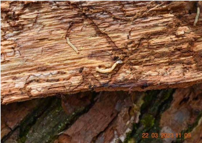
Larven des Eichenprachtkäfers haben die Bastschicht des Baumes zerstört

Anders als im letzten Jahr ist allerdings die Wasserversorgung der Fichten aktuell deutlich günstiger. In den meisten Regionen dürften damit auch die Vitalität und Abwehrbereitschaft der Bäume wieder gestiegen sein.