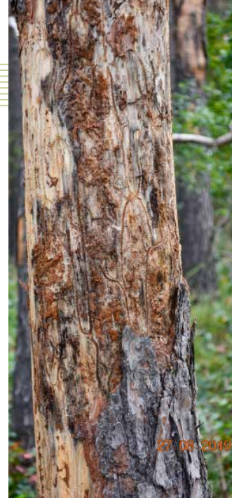
Durch Kiefernborkekäferbefall abgestorbene Kiefer

Schäden an älteren Eichen haben im Jahr 2022 nochmals deutlich an Umfang zugenommen. Die seit mehreren Jahren stark geschwächten Eichenbestände werden in den letzten Jahren vermehrt durch Eichen-