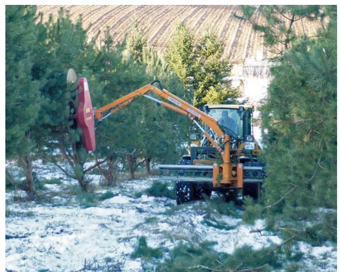
Pflege einer Kiefern-Samenanlage: Rückschnitt

Ein Überblick über die Erntemenge aus Samenplantagen bei Baumarten, die dem FoVG unterliegen, zeigt die Tabelle auf Seite 37. Das Saatgut kommt als höherwertiges Vermehrungsgut auf den Markt und kann sowohl für Naturschutzaufgaben wie auch für forstliche Zwecke verwendet werden.