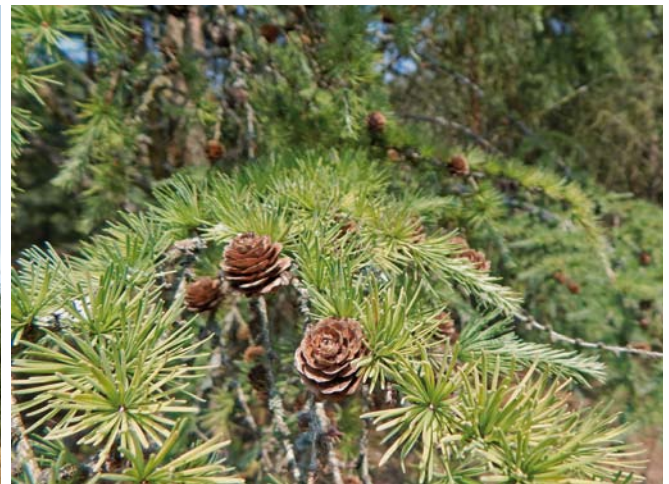
Hybridlärchen-Samenplantage Stackelitz (Sachsen-Anhalt), rechts: Zapfen von Hybridlärchen