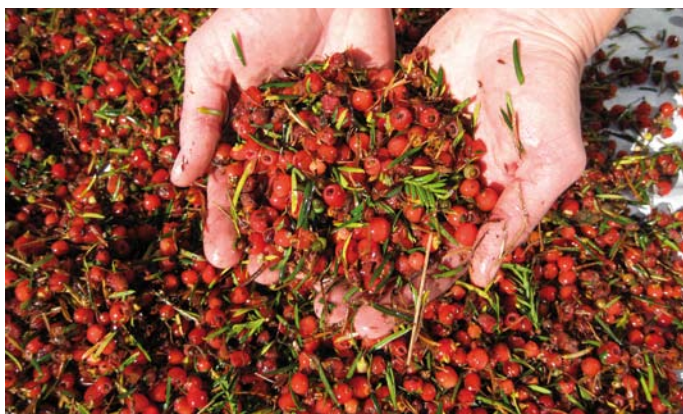
Eibensaatgut, noch vom roten Samenmantel (Arillus) umgeben

Neben der Erhaltung zielt das Übereinkommen über die Biologische Vielfalt ausdrücklich auch auf die nachhaltige Nutzung ihrer Bestandteile ab sowie auf die ausgewogene und gerechte Aufteilung der sich aus der Nutzung ergebenden Vorteile.