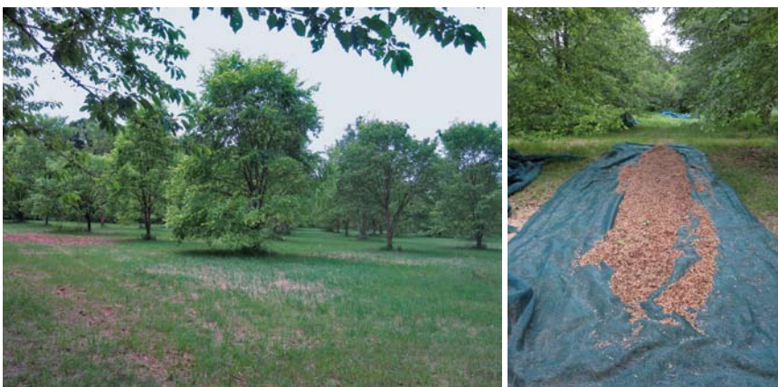
Flatterulmen-Samenplantage Fürstenberg (Niedersachsen), rechts: Ernte 2020

Bei der nicht-forstlichen Verwendung in der freien Landschaft ist jedoch das Bundesnaturschutzgesetz (BNatSchG), insb. § 40, zu beachten. Bei den meisten Samenplantagen dürfte, ggf. nach entsprechender Registrierung, auch eine BNatSchG konforme Verwendung außerhalb des Waldes zukünftig möglich sein.