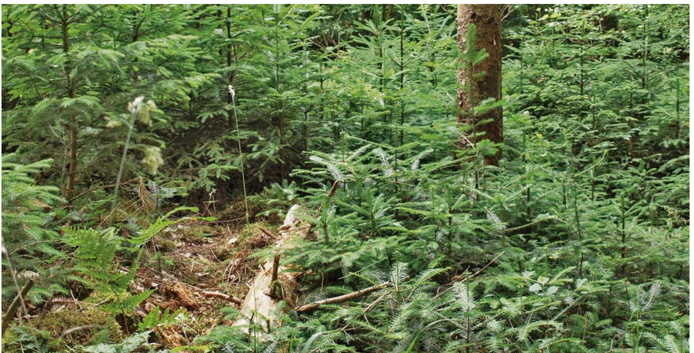
Natürliche Verjüngung der Weiß-Tanne im Mischbestand im südlichen Niedersachsen

Standort: Erste Auswertungen (Schmucker und Boots 2019) zeigen, dass die Bestände zum großen Teil auf Standorten mit guter Wasserversorgung und mittlerer Trophie stocken. Weitere Studien bezüglich geeigneter Standortsamplituden