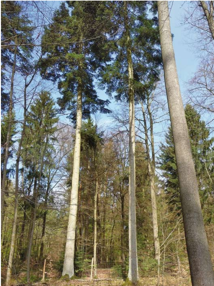
Altbäume der Weiß-Tanne im Mischbestand