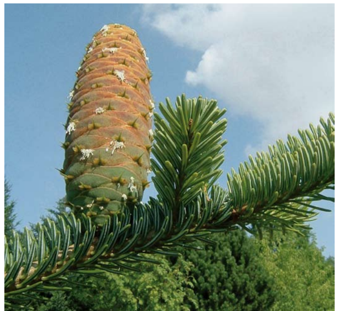
Zapfen der Weiß-Tanne

Sicherlich wird die Weiß-Tanne nicht alle forstlichen Probleme des Klimawandels lösen. Aber sie kann eine unter vielen Alternativen für die Zukunft sein. Die Dynamik der Entwicklung erfordert eine noch engere Zusammenarbeit von praxisorientierter Forschung der NW-FVA mit den Beschäftigten vor Ort. Die Erfahrung aus der Praxis und die wissenschaftlichen Versuchsergebnisse können zusammen eine wichtige Grundlage für künftige Anbauempfehlungen darstellen.