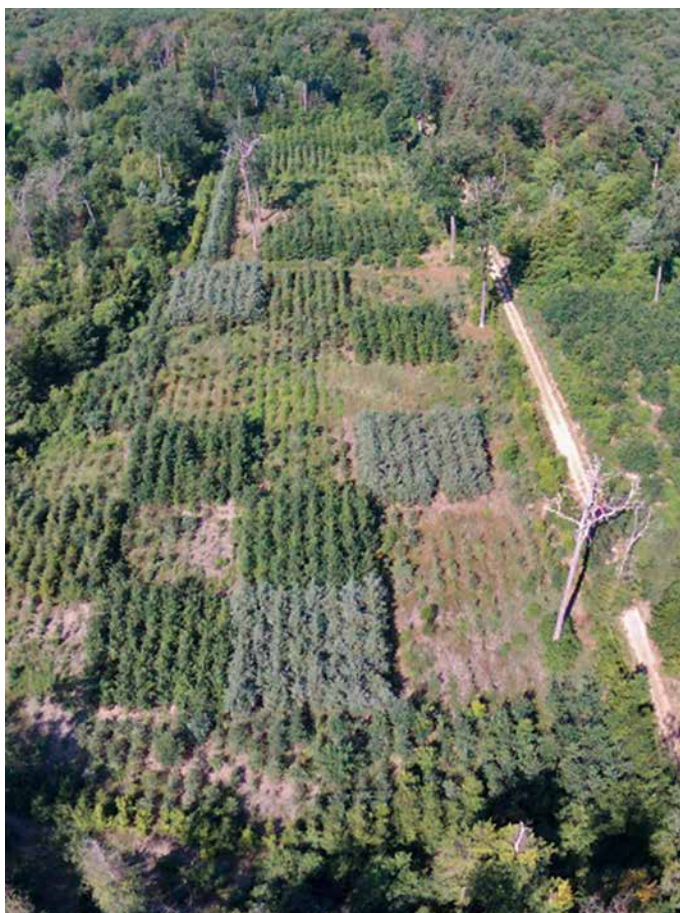
Anbauversuch mit mediterranen und heimischen Eichenarten sowie Roteiche, Kiefer und Douglasie im hessischen Forstamt Lampertheim. Links: Der Versuch im Juli 2019 und rechts: Höhenwachstum nach 11 Jahren, Mittelwerte und Standardabweichungen von drei Wiederholungen

Daher wurden von der NW-FVA parallel zu den Untersuchungsvorhaben etablierter Praxisbestände zuletzt Anbauversuche mit Alternativbaumarten auf verschiedenen Standorten neu angelegt. Als Referenzbaumarten enthalten diese Versuche auch die heimische Winterlinde und die bewährte Douglasie, um die Standortanpassung, Mortalität und Wuchsleistung zu der Untersuchungsbaumart besser einordnen zu können. Wissenschaftliche Versuche als wesentliche Grundlage fundierter Anbauempfehlungen erstrecken sich normalerweise über Zeiträume von mindestens mehreren Jahrzehnten. Nur in einer solch langen Testphase lassen sich neben Wuchsleistungen auch die Auswirkungen, positive sowie negative, auf das heimische Ökosystem ausreichend überprüfen.