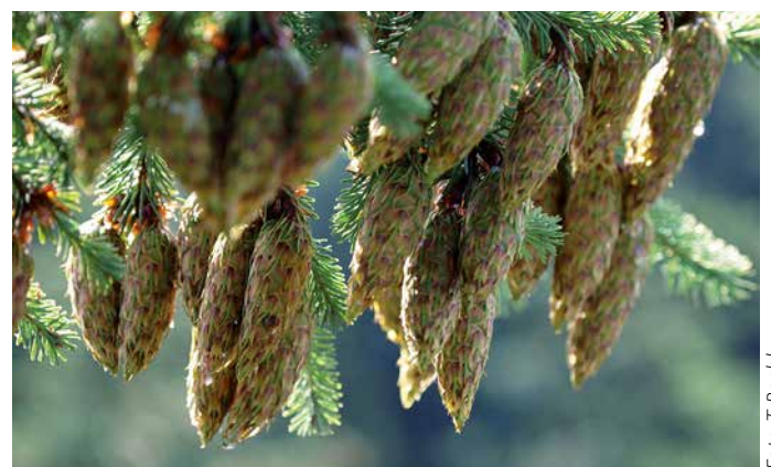
Zapfen der Douglasie

Nach Daten der letzten Bundeswaldinventur (BWI3 aus dem Jahre 2012) stammten 73 % der Verjüngungsfläche der Douglasie aus künstlicher Verjüngung. Dieser Anteil dürfte aufgrund der witterungsbedingt aufgetretenen Waldschäden eher eine noch zunehmende Tendenz aufweisen. Bislang wird Vermehrungsgut der Douglasie größtenteils in zugelassenen Saatguterntebeständen (SEB) gewonnen. Deren behördliche Zulassung verlangt bestimmte, gesetzlich vorgeschriebene Mindestkriterien: Neben Formeigenschaften und Vitalität müssen SEB aus fruktifikationsfähigen Bäumen bestehen, die so zahlreich und gut verteilt sind, dass zwischen den Bäumen eine ausreichende gegenseitige Befruchtung gewährleistet ist. Vorgeschrieben sind mindestens 40 Bäume mit einem Mindestalter von 60 Jahren. Schon die Einhaltung dieser Minimalvorgaben engt die Verfügbarkeit