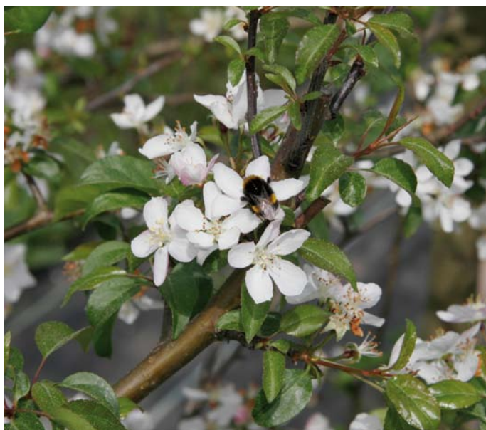
Eine Hummel bei der Bestäubung von Wildapfelblüten

Die natürlichen Lebensräume des Wildapfels sind sehr selten geworden, so dass sein Fortbestand in vielfacher Hinsicht stark gefährdet ist. Zusätzlich zu den oben bereits aufgezählten Ursachen (Überalterung, geringe Populationsgrößen, genetische Isolation) hat die Hybridisierung mit Kulturäpfeln, die vom Asiatischen Wildapfel ( Malus sieversii ) abstammen, zum Verlust der reinen Wildform und damit gebietsheimischer genetischer Vielfalt geführt. Die Erhaltung des Wildapfels zählt zu den großen Herausforderungen des Artenschutzes.