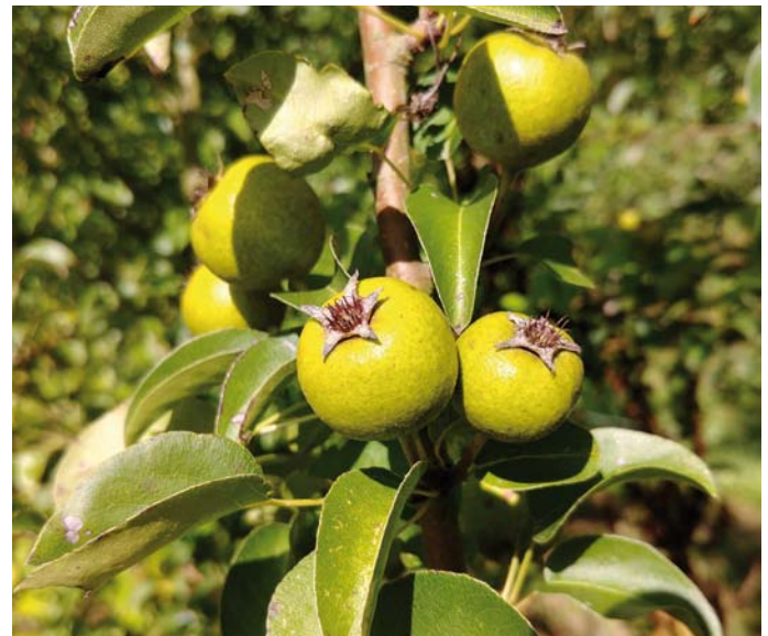
Früchte der Wildbirne