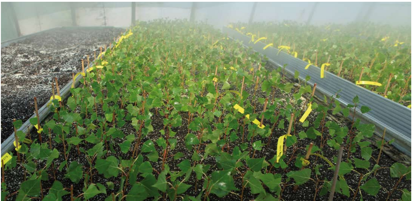
Stecklingsanzucht der Schwarzpappel im Nebeltunnel