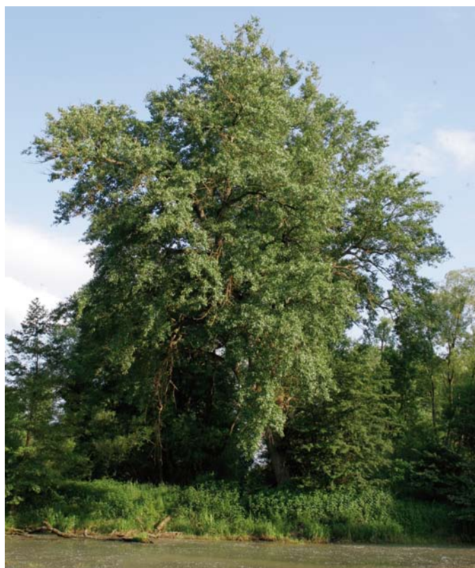
Schwarzpappel im Überflutungsbereich der Eder

Genetische Vielfalt kann als eine Art kostenlos verfügbarer „Versicherungsschutz“ für die Baumarten angesehen werden, insbesondere im Hinblick auf mögliche Klimaveränderungen (vgl. Eichhorn et al. 2016). Großflächige Rodungen, Wiederaufforstungen mit nicht angepasstem Vermehrungsgut, verschiedene forstliche Nutzungsarten und der Verlust ganzer Lebensräume haben den Genpool von Bäumen seit Jahrhunderten verändert. Da genetische Vielfalt während langer evolutiver Prozesse entstanden und Verluste nicht wieder rückgängig gemacht werden können, wird der Erhaltung genetischer Ressourcen im Rahmen internationaler Abkommen, wie z. B. der Biodiversitätskonvention (Convention on Biological Diversity = CBD), eine hohe Priorität eingeräumt.