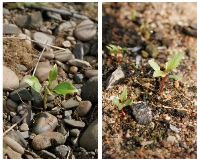
Schwarzpappelverjüngung: Wurzelbrut (li) und Keimling (re) im Kiesbett der Eder

Die Voraussetzungen für die natürliche Verbreitung und die Überlebensfähigkeit der heimischen Schwarzpappel ( Populus nigra L.) haben sich in den letzten Jahrhunderten erheblich verschlechtert. Als Hauptursache gilt die Zerstörung der Auwälder mit ungestörter Überflutungsdynamik. Grundwasserabsenkungen haben die Bäume zusätzlich oft auch physiologisch geschwächt und damit einem erhöhten Befallsdruck pathogener Organismen ausgesetzt. Darüber hinaus sind seit dem 18. Jahrhundert Anbauten mit Pappelhybriden verbreitet, die aufgrund höherer Wuchsleistungen unseren heimischen Pappelarten vorgezogen worden sind. Zusätzlich besteht auch bei dieser Art eine generelle Gefahr der Einkreuzung durch andere Pappelarten und -hybriden. Aufgrund der relativ schwierigen morphologischen Differenzierbarkeit der heimischen Schwarzpappel sind genetische Verfahren zur taxonomischen Artunterscheidung entwickelt worden. Für Erhaltungsmaßnahmen werden diese Methoden heute routinemäßig an der NW-FVA eingesetzt.