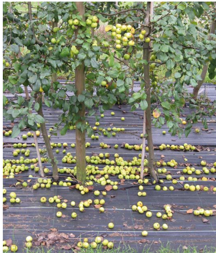
Wildapfel-Samenplantage der Herkunft „Hessisches Berg- und Hügelland“

Die hohen Qualitätsstandards (siehe Tabelle Seite 45), denen Samenplantagen seltener Arten genügen müssen, werden hier am Beispiel des Wildapfels näher erläutert. Wichtige Kriterien betreffen die genetischen Eigenschaften des Ausgangsmaterials, den Aufbau von Samenplantagen sowie die Möglichkeiten der Identitätskontrolle von Vermehrungsgut auf dem Markt.