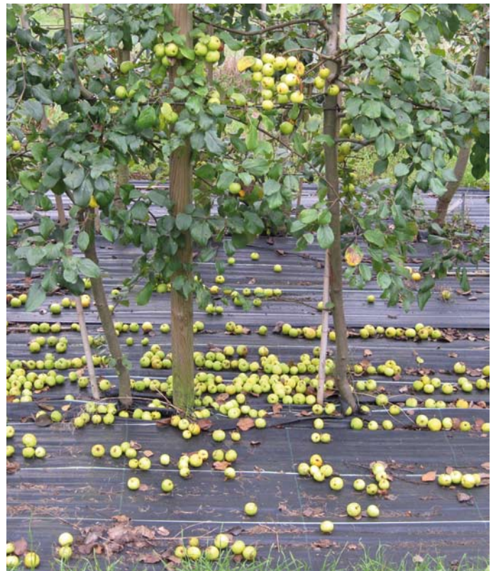
Wildapfel-Samenplantage der Herkunft „Hessisches Berg- und Hügelland“

Die hohen Qualitätsstandards (siehe Tabelle Seite 45), denen Samenplantagen seltener Arten genügen müssen, werden hier am Beispiel des Wildapfels näher erläutert. Wichtige Kriterien betreffen die genetischen Eigenschaften des Ausgangsmaterials, den Aufbau von Samenplantagen sowie die Möglichkeiten der Identitätskontrolle von Vermehrungsgut auf dem Markt.