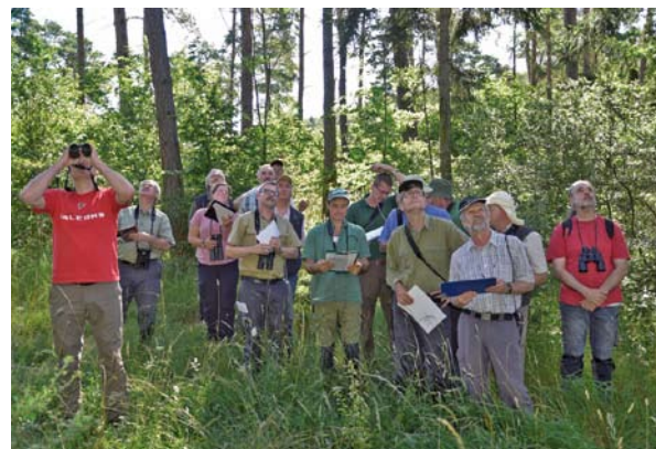
Schulung der WZE-Aufnahmeteams

Auswerteeinheiten (z. B. Eiche, alle Alter), die sowohl in der Altersstruktur als auch in den Kronenverlichtungswerten ein breites Spektrum umfassen. Mit dem 8 km x 8 km-Raster, ergänzt um ein 4 km x 4 km-Raster für Buche und Eiche, werden – mit Abstrichen bei den anderen Laubbäumen (bis 60 Jahre) und der Fichte (bis 60 Jahre) – für die Baumartengruppen belastbare Ergebnisse für die Kronenverlichtungswerte erzielt.