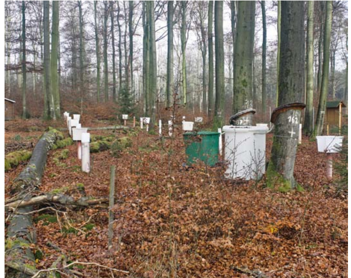
Intensiv-Monitoringfläche Solling, Buche

Das Untersuchungsdesign der Forstlichen Umweltkontrolle für die Bereiche Level I, Intensives Forstliches Umweltmonitoring und Experimentalflächen für die Länder Hessen, Niedersachsen, Bremen, Sachsen-Anhalt und Schleswig-Holstein zeigen die Abbildungen unten.