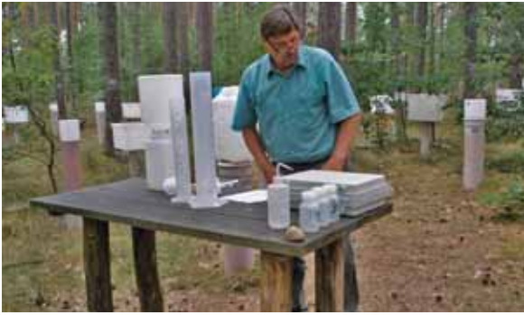
Qualitätskontrolle von Wasserproben