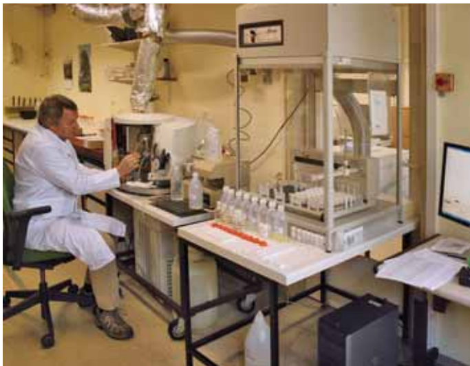
Messungen von Wasser-, Boden- und Humusproben im Labor der NW-FVA

tragungen von Analysedaten per Hand weitestgehend vermieden. Im LIMS werden weitere methodenübergreifende Qualitätsprüfungen durchgeführt. Neben den Standardmaterialprüfungen und der dazugehörigen Führung von Blindwert- und Mittelwertkontrollkarten erfolgen diverse Bilanzprüfungen (Stickstoffbilanz, Kohlenstoffbilanz, Na/Cl-Verhältnis, Ionen- und Leitfähigkeitsbilanz bei Wasserproben), pH-Wert-Plausibilitätsprüfungen und eine Kontrolle der Wiederholungsproben. Im Falle der Nichteinhaltung vorgegebener Kriterien werden automatisch Nachmessungen vom System angefordert, die dann im Labor durchgeführt werden.