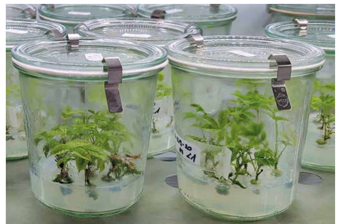
In-vitro-Vermehrung potenziell ETS-toleranter Eschen

etabliert und deren Bäume nach anderen Kriterien als der ETS-Toleranz ausgewählt worden sind (Form, Vitalität, Wuchsleistung etc.). Ziel des Versuches war es, genauere Kenntnis über das Infektionsgeschehen zu erhalten und mögliche Unterschiede in der Befallsstärke zwischen Nachkommen einzelner Samenbäume festzustellen. So konnten in den Samenplantagen keine Bäume gefunden werden, welche eine deutliche Differenzierung hinsichtlich der ETS-Toleranz in den Nachkommen hervorbrachten. Innerhalb eines 4-jährigen Beobachtungszeitraums führte das ETS an allen Nachkommenschaften zu hohen Schäden und Ausfällen (Abb. oben). Dem Aufbau neuer Züchtungskollektive durch gezielte Selektion und der anschließenden Vermehrung potenziell ETS-toleranter Eschen kommt künftig daher eine besondere Bedeutung zu. Ferner sollte berücksichtigt werden, dass natürliche Anpassungsvorgänge, vor allem, wenn damit eine sehr starke Reduktion der Bestandesgrößen einhergeht, auch mit einer deutlichen Verringerung genetischer Vielfalt verbunden sind