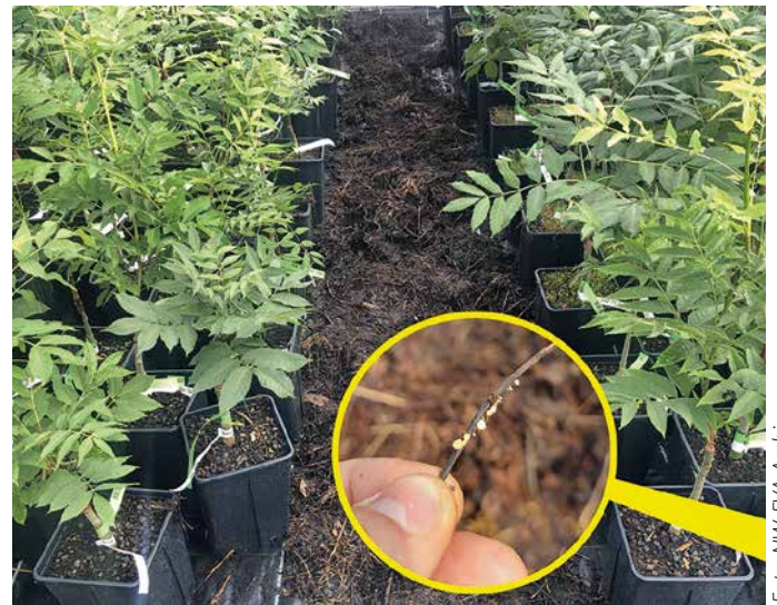
Anzucht generativer Nachkommen ausgewählter Eschenplusbäume zur Überprüfung des Selektionserfolgs auf verschiedenen Versuchsflächen