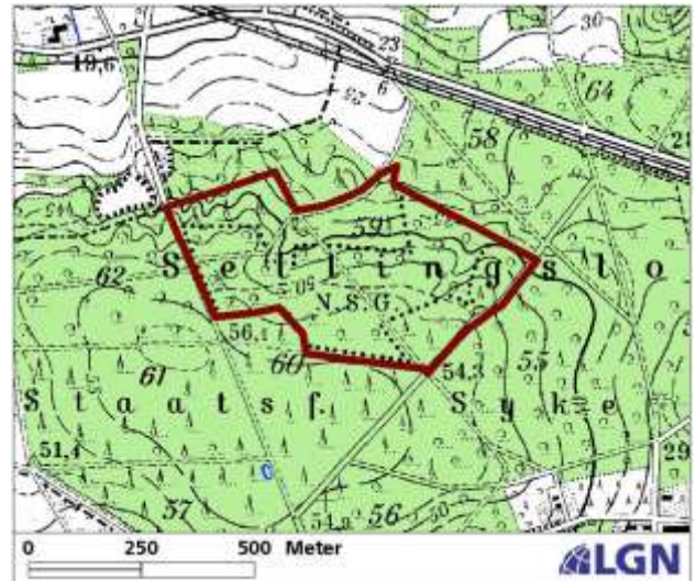
Abb. 1: Lage und Abgrenzung des Naturwaldes Burckhardtshöhe

Zwischen Bruchhausen-Vilsen und Hoya im Waldgebiet „Sellingsloh“ liegt der Naturwald Burckhardtshöhe. Er gehört zu den Naturwäldern der „ersten Generation“ und wurde im Jahr 1974 zunächst mit einer Flächengröße von rund 13 Hektar aus der Nutzung genommen. 22 Jahre später folgte die Arrondierung und Erweiterung auf knapp 22 Hektar. Damit greifen die Grenzen der Burckhardtshöhe über diejenigen des 1986 ausgewiesenen gleichnamigen Naturschutzgebietes hinaus.