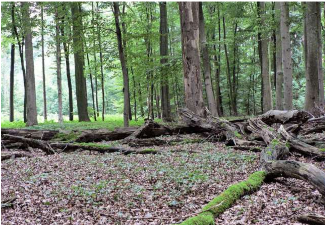
Abb. 2: Verjüngungsdynamik im Naturwald Burckhardtshöhe