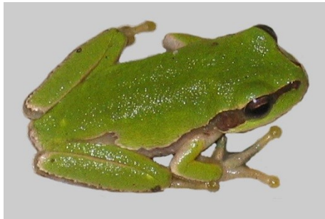
Abb. 3: Im Umfeld des Naturwaldes kommt der Laubfrosch vor

Der Naturwald wird von mehreren kleinen, mehr oder weniger Wasser führenden Gräben durchzogen, die in die Auer entwässern. Dieser Bach bildet zugleich die nördliche Grenze des Naturwaldes.