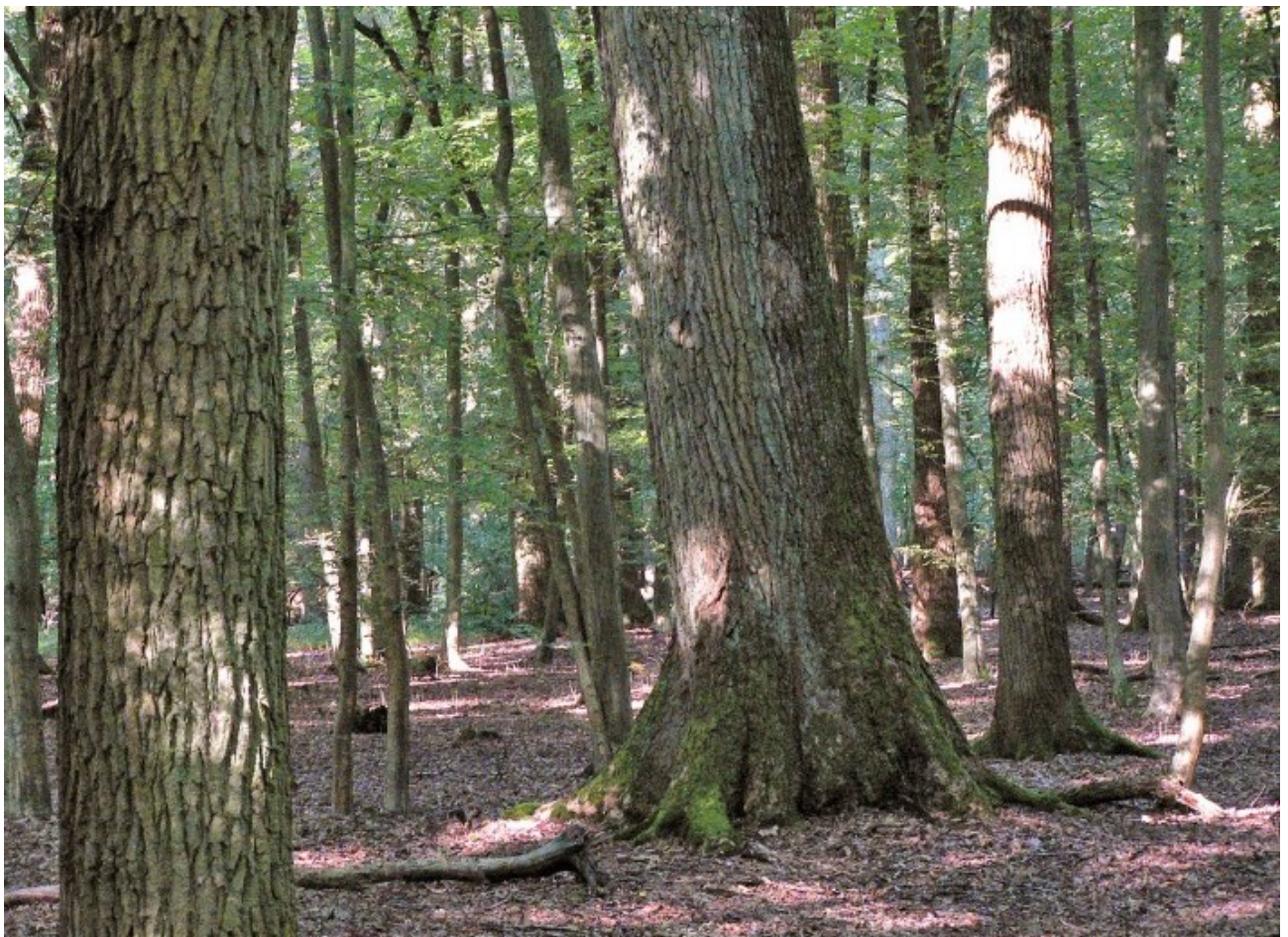
Abb. 2: Stieleichen-Hainbuchenwald im Naturwald Cananohe