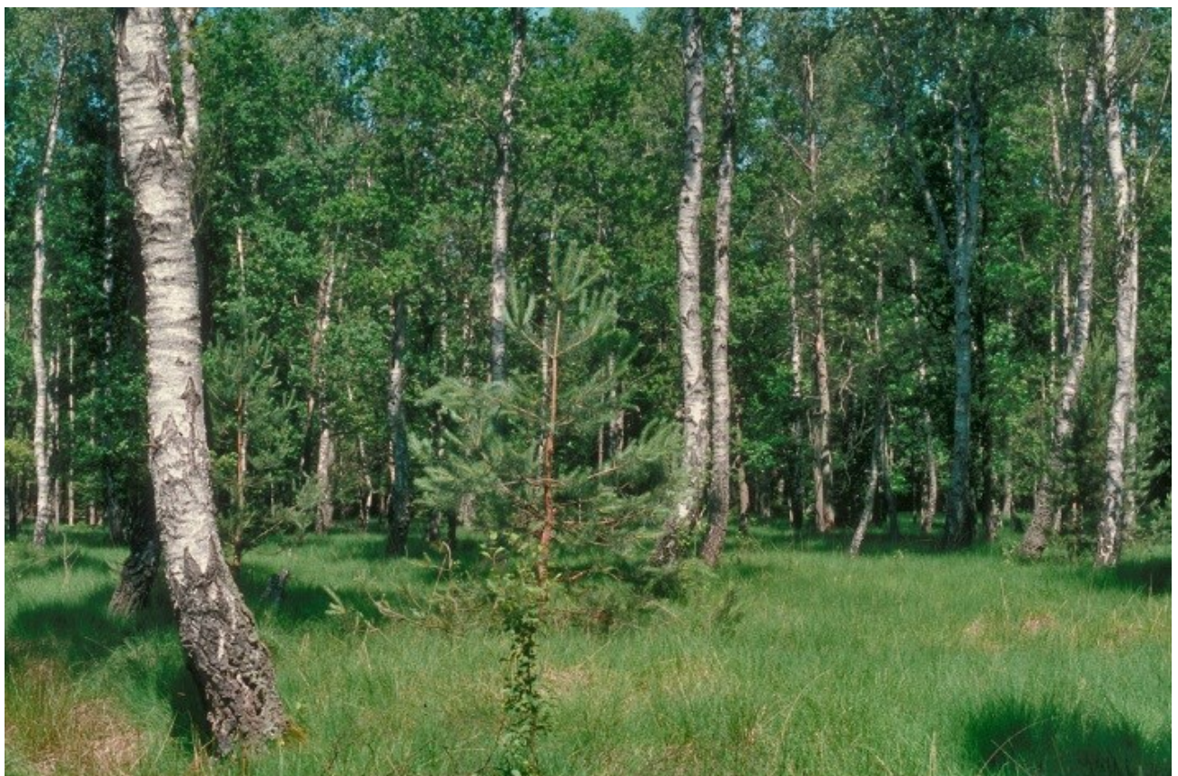
Abb. 2: Pfeifengras-Moorbirkenwald im Brambosteler Moor