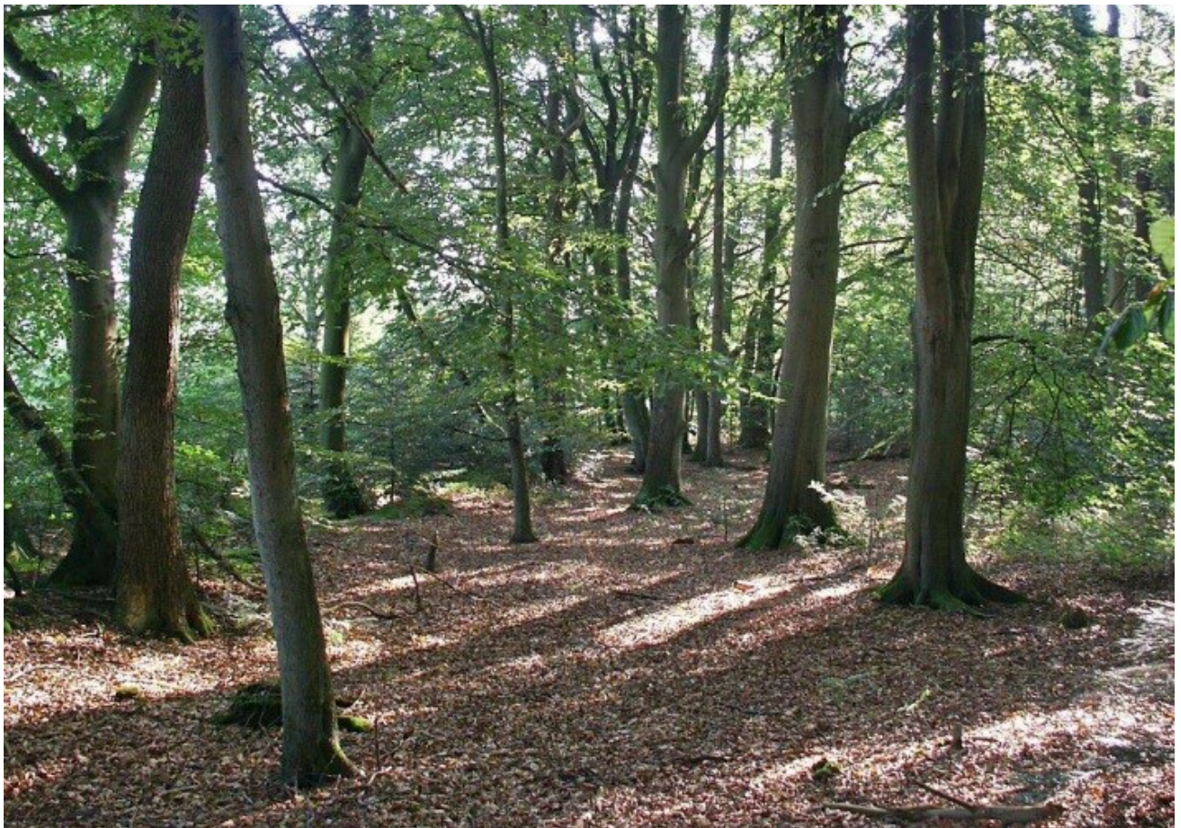
Abb. 2: Alter Baumbestand im Naturwald Ahlershorst